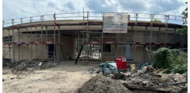
Das Rasteder Freibad – immer noch eine Großbaustelle.