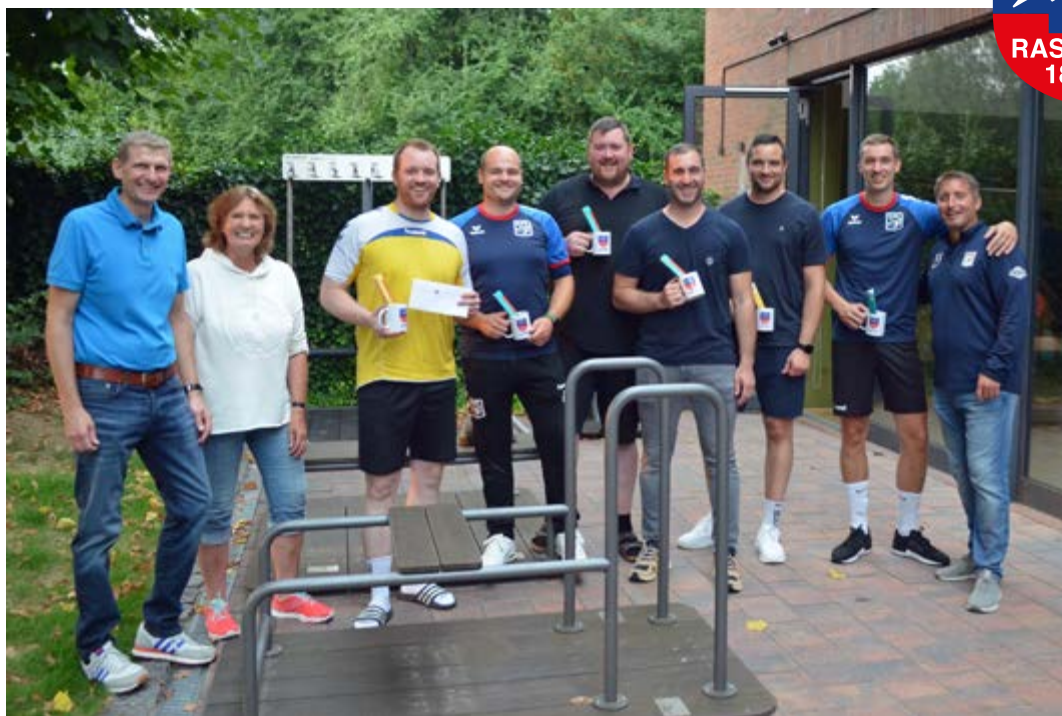
„Belohnung“ für den Einsatz – 1. Herren der VfL-Handballer mit Vorstand und Geschäftsführung

Dieses Motto des DOSB gilt heute wie schon seit Jahrzehnten. Einmal mehr haben die Handballer unserer 1. Herrenmannschaft gezeigt, wie man dieses Motto durch besonderes Engagement für den Verein mit Leben füllen kann. Sie haben an zahlreichen Wochenenden