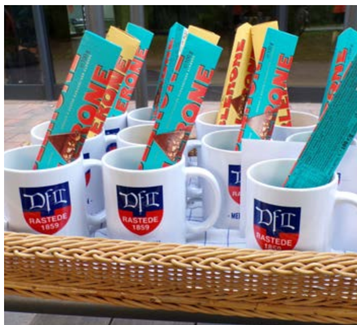
Es ist angerichtet