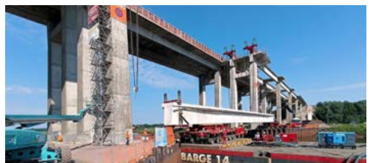
Brückenträger wurde am Südufer auf einen Rollwagen zum Weitertransport über die Hunte abgelegt