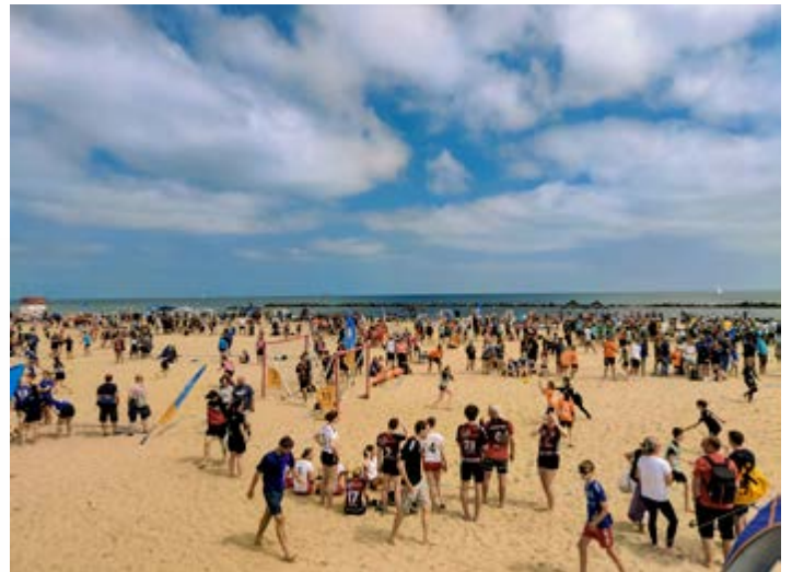
Strandleben in Damp

Ein spezieller Dank geht an die Sponsoren unserer DAMP-Shirts. Die Shirts haben dafür gesorgt, dass wir als VfL Rastede am Strand immer gut erkennbar waren.