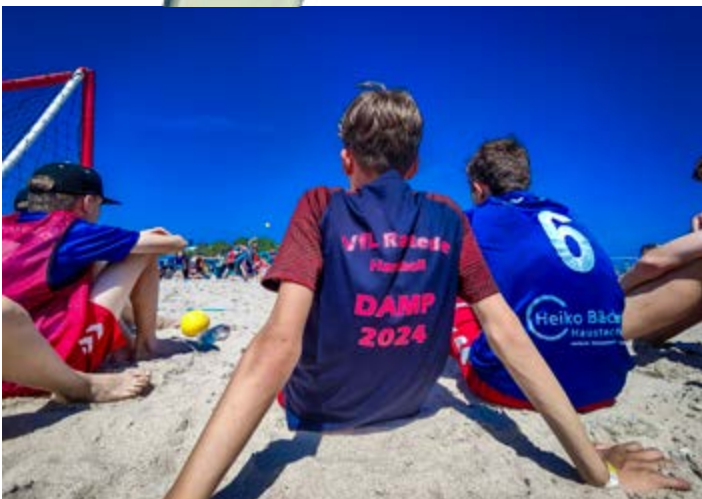
Das DAMP 2024-Shirt

Und natürlich geht auch ein riesiges Dankeschön an die vielen Trainer*innen, Betreuer*innen und Eltern, die sich zum Teil extra dafür Urlaub genommen haben, um unseren jungen Handballern dieses tolle Wochenende zu ermöglichen! Wir freuen uns schon auf die Fahrt im nächsten Jahr!