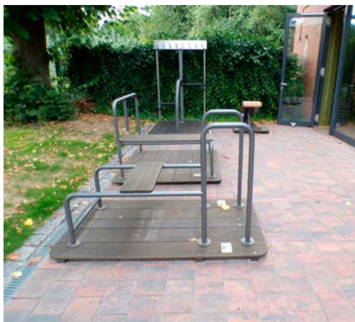
Die neue Terrasse mit Outdoor-Fitness-Geräten