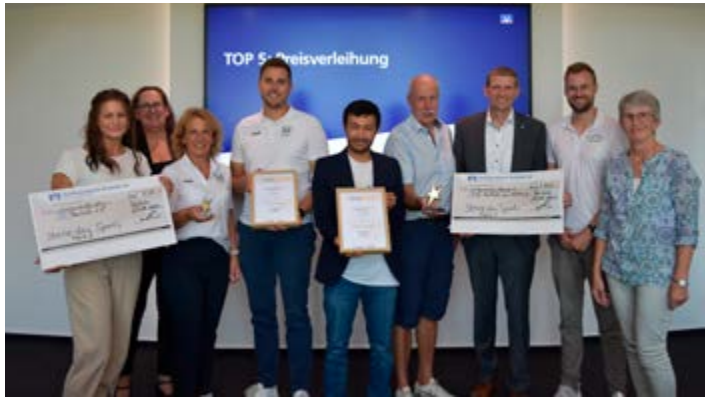
Preisverleihung in der Raiffeisenbank Rastede