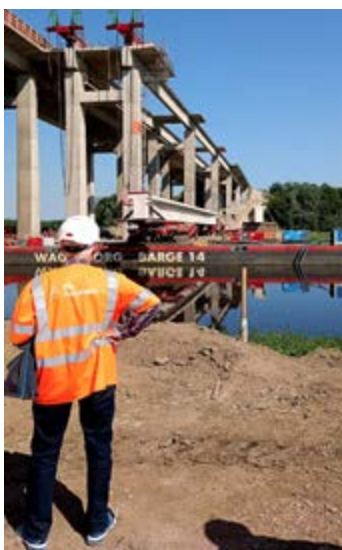
Der Träger wird mit dem Ponton vom Süd- zum Nordufer ganz langsam über die Hunte transportiert