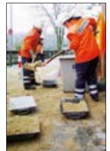
Bevor die Feuerwehrleute in den Korb der Drehleiter klettern konnten (l.) musste erst Sand gegen Glatteis gestreut werden (r.).