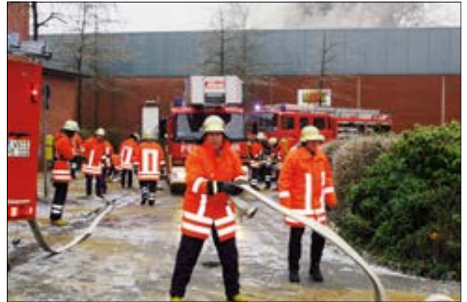
Rauchschwaden drängen am Heiligabend aus dem Dach der Rasteder Sporthalle an der Feldbreite. Über Rundfunk wurden Anlieger aufgefordert, Türen und Fenster zu schließen.

Heiligabend Großbrand in Rastede – Sechs Wehren sind im Einsatz